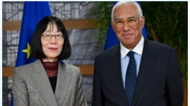
Il presidente del Consiglio europeo, Antonio Costa (a destra) insieme alla presidente della Corte penale internazionale (CPI), Tomoko Akane, a Bruxelles, il 6 febbraio 2025.

“È tempo che l’Ungheria riveda cosa stiamo facendo in un’organizzazione internazionale che è sottoposta a sanzioni statunitensi! Stanno soffiando nuovi venti nella politica internazionale. Lo chiamiamo il Trump-tornado”, ha detto Orbán su X.